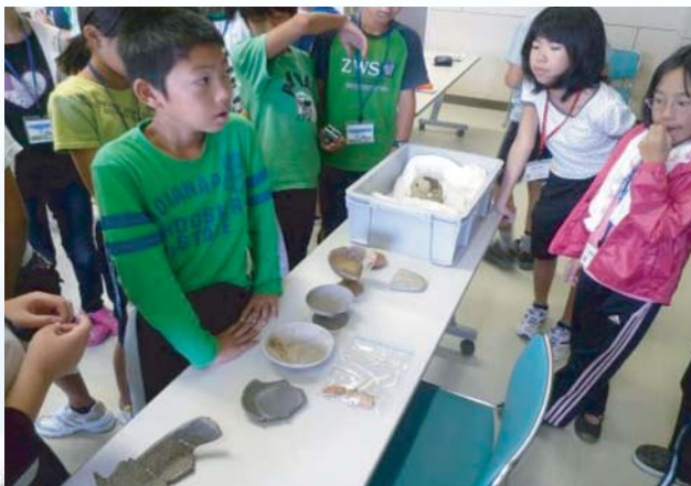
講義・演習：能登式製塩土器。塩は土器で運ばれた。