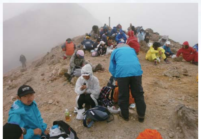
乗鞍剣ヶ峰登山：貴重な塩を峠越えて運んだ歴史体験のプログラム。