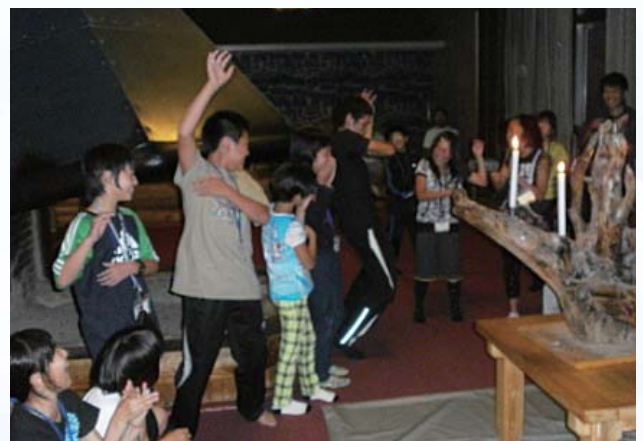
初対面の子もたちが長期宿泊体験の中で、人間関係を育み、最後はひとつの輪になって踊りました。