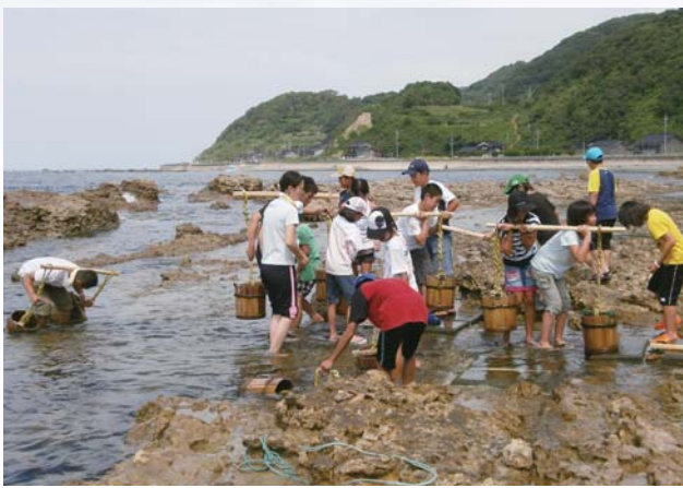
揚げ浜式製塩体験・塩汲み：能登から飛騨には、古代より塩が運ばれていた。