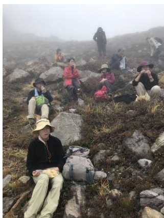
お待ちかねの弁当タイム