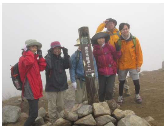
頂上に到着。霧がすごいです。