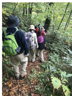
下りは特に慎重に