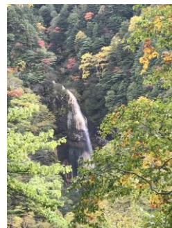
白水の滝で癒されます

まとめ 今年度乗鞍青少年交流の家としては久しぶりに青年対象の教育事業として「のりくら探険隊」を実施しました。さまざまな年代の参加者が集まり和気あいあいとした雰囲気の中で紅葉の焼岳を楽しみました。来年度はさらに魅力あるプログラムを作っていきたいと思います。