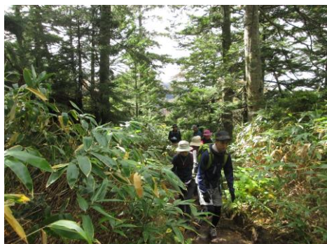
登り始めは熊笹が茂っています。