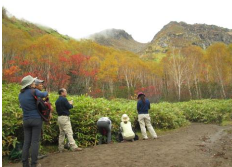
紅葉の絶景と焼岳が見えます。