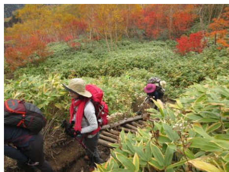
梯子を慎重に登ります。