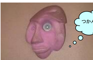
⑯ 顔の彫刻？ 10点 かお ちょうこく