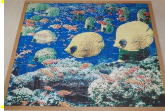
⑤□□□□~Tropical sea~ 3点