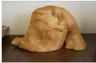
⑭これは何だろう？ 5点